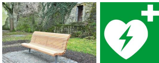
Spendenprojekte ‚Bürgerbänke und Defis für Backnang‘